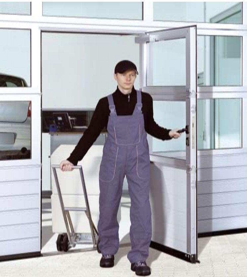
Калитка без порога предотвращает аварийные ситуации и облегчает проезд для колесного транспорта